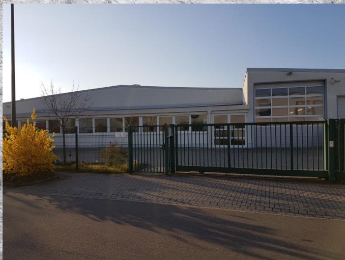
Hauptwerk BOBBY in der Pfalz