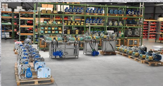
Ausschnitt Produktion und Warenlager

D-67098 Bad Dürkheim Robert-Bunsen-Str. 5 www.bobbyanlage.de info@bobbyanlage.de Tel.: +49(0)6322-1219 Fax: +49(0)6322-68937